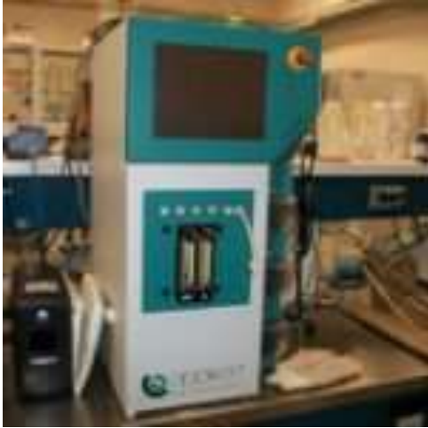
Biorreactor de 2 L (Marca Applikon),