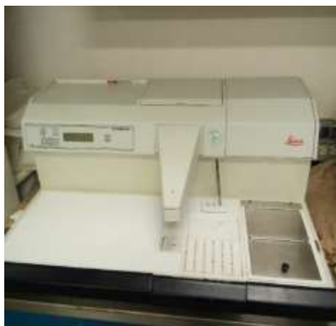
Inclusor de parafina

INCLUSOR DE PARAFINA: es un equipo ampliamente utilizado en patología y diagnóstico histológico, investigación científica y experimentación, en hospitales, universidades, institutos para animales y plantas, así como para departamentos de inspección alimenticia. Con este equipo se embeben tejidos-muestra en parafina, y posteriormente se cortan con un micrótopo. Es utilizado en laboratorios de histopatología y microbiología. Industria alimenticia y sector salud.