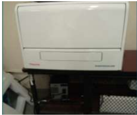
Lector de Microplaca Varioskan Lux

El laboratorio de ecología molecular también posee centrifugas refrigeradas, campana de flujo laminar, incubadora e incubadora de CO 2 . Igualmente tiene equipos de electroforesis agarosa y acrilamida, HPLC, Cromatografía líquida, Espectrofotómetro UV-VIS, ultracongeladores, termociclador y liofilizador. Cuenta además con rotavapores, shaker y sistema de foto documentación.