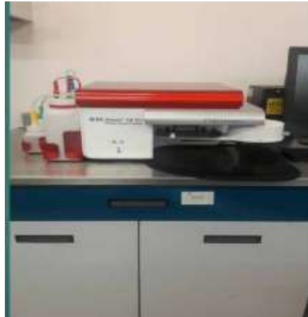
Citómetro de Flujo

CITÓMETRO DE FLUJO: tecnología biofísica basada en la utilización de luz láser, empleada en el recuento y clasificación de células según sus características morfológicas, presencia de biomarcadores, y en la ingeniería de proteínas. Las aplicaciones más relevantes de la citometría de flujo en la práctica médica se relacionan con la hematología e inmunología clínicas, midiendo parámetros como número y clasificación de células sanguíneas. Tiene aplicaciones también en la industria alimenticia.