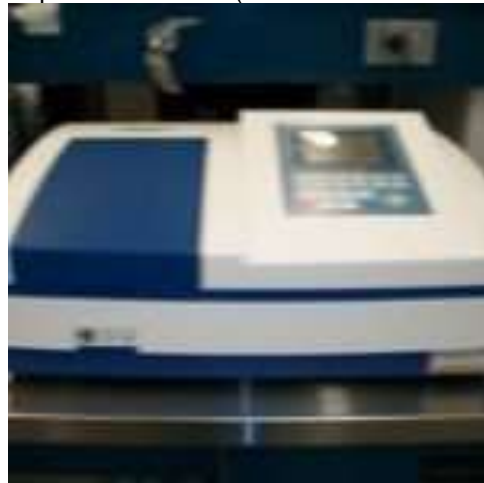
Documentador de Geles (Multidoc It W/M26, Marca UVP),

Espectrofotómetro (Biochrom Modelo: Simplinano),