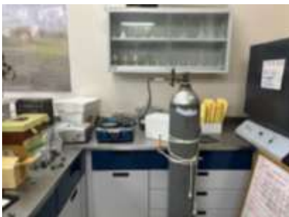
Equipo de bomba de presión para la medición de potencial hídrico en hojas y ramas en laboratorio y campo.