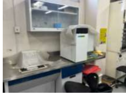
Infraestructura para análisis estequiométricos en plantas. Analizador elemental Perkin Elmer 2400 para análisis de Nitrógeno, Carbón e Hidrógeno.