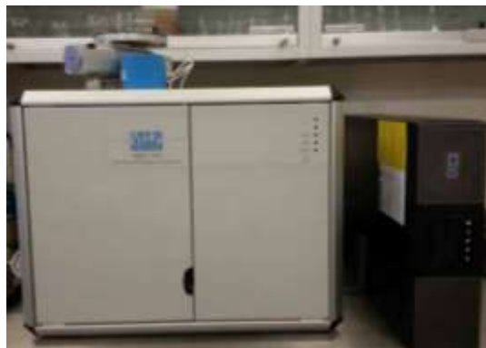
Analizador de Nitrógeno

ANALIZADOR DE NITRÓGENO. Para la determinación cuantitativa del contenido de Proteína (proteína cruda) en alimentos, ingredientes, tejidos, etc. Área bioquímica. Industria: Las principales aplicaciones se enmarcan en el campo de la industria alimenticia, análisis de alimentos, ingredientes, análisis de tejidos de organismos (animales, vegetales, etc.), medicina forense, e investigación farmacéutica.