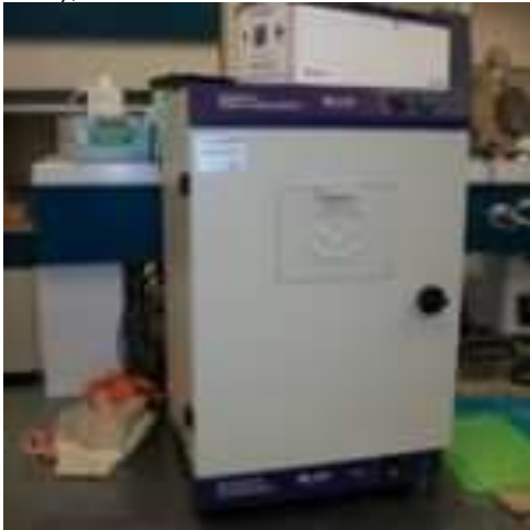
Incubadora con agitacion (Modelo SI6, Marca Shel Lab.),