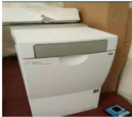
Bio-analizador de Electroforesis

BIO-ANALIZADOR DE ELECTROFORESIS: Equipo utilizado para realizar análisis electroforético capilar de bio moléculas tales como el ADN, ARN y proteínas. Las ventajas principales de esta tecnología son su precisión, alta reproducibilidad de los datos, tiempos de análisis reducido, un mínimo de consumo de muestra, una mínima exposición a materiales peligrosos, facilidad de uso debido a su automatización. Industria alimenticia, sector salud, Bioquímica y Biología molecular.