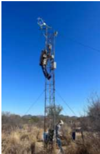
Torre de covarianza de vórtices que mide flujos de Dióxido de carbono ( \text{CO}_2 ) y agua ( \text{H}_2\text{O} ) en el Rancho El Churi en sitio manejado de pasto buffel (15 años de monitoreo). Segundo sitio con la mayor longevidad en muestreos de productividad neta en ecosistemas de todo México.

Este laboratorio investiga las relaciones funcionales de las especies de plantas con las condiciones ambientales extremas de la región del Desierto Sonorense. Para realizar un número importante de estos estudios, el laboratorio ha desarrollado una infraestructura de equipamiento en campo para el monitoreo a largo plazo de la productividad neta de dos ecosistemas desérticos mediante la técnica de covarianza de vórtices (Eddy-Covariance fluxes) desde hace más de 15 años en un rancho privado denominado El Churi. El grupo estudia los controles que las limitantes ambientales, de recursos y de interacciones intra- e inter-específicas ejercen sobre el funcionamiento de las especies, comunidades y ecosistemas de las regiones secas del Noroeste de México. Además, el grupo cuenta con equipamiento para el análisis elemental de tejidos vegetales y ha desarrollado el área de Estequiometría Ecológica, que consiste en establecer las diferencias en el nicho ecológico y biogeoquímico de especies y tipos funcionales en base a su composición bioelemental.