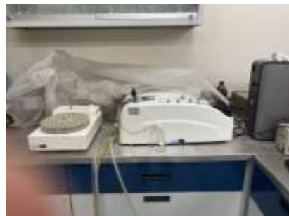
Infraestructura para análisis estequiométricos en plantas. Autoanalizador de flujo rápido para análisis de Fósforo en hojas.