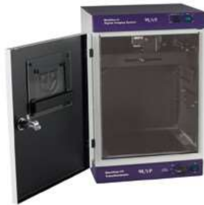
Documentador de Geles (Multidoc It W/M26, Marca UVP),