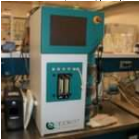
Incubadora con agitación (Modelo SI6, Marca Shel Lab.),

El laboratorio de bioprocesos cuenta también con: Biorreactor de 2 L (Marca Applikon),