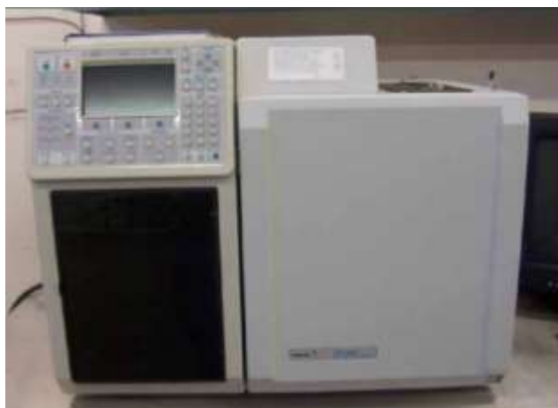
Cromatógrafo de Gases

HPLC, Cromatógrafo de Líquidos de Alta Resolución: Análisis cualitativo y cuantitativo de amino ácidos. Área bioquímica. Industria: Las principales aplicaciones se enmarcan en el campo de la industria alimenticia, análisis de alimentos, análisis de tejidos de organismos (animales, vegetales, etc.), medicina forense, e investigación farmacéutica.