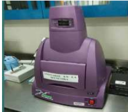
Fotodocumentador de Geles

FOTODOCUMENTADOR DE GELES: Equipo utilizado para imágenes digitales de geles. Visualiza las bandas de ácidos nucleicos después de la electroforesis y obtiene una imagen de él. Sus principales aplicaciones son proteína y ácidos nucleicos. USOS: Industria alimenticia, sector salud, Bioquímica y Biología molecular.