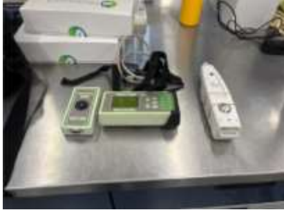
Equipos portátiles para la medición de fluorescencia de hojas en campo.