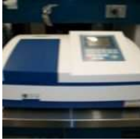
Espectrofotómetro (Biochrom Modelo: Simplinano),