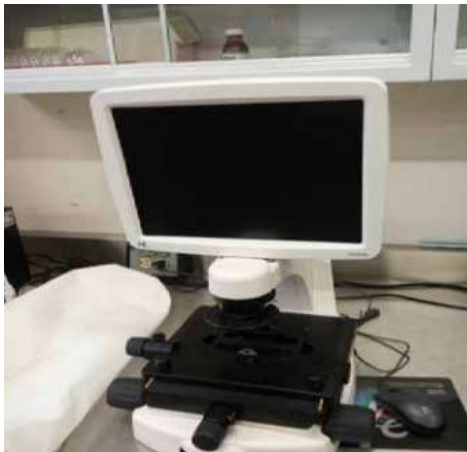
Microscopio Invertido de Fluorescencia

MICROSCOPIO INVERTIDO DE FLUORESCENCIA: Este microscopio permite observar muestras tanto en portas como en placas de petri o placas de pocillos ya que, al ser invertido, los objetivos acceden por debajo de la muestra. Esto posibilita observar células vivas inmersas en medio de cultivo. Así mismo permite observar cortes histológicos que hayan sido marcados con algún tipo de sonda fluorescente y realizar un análisis más específico y puntual. Es utilizado en laboratorios de histopatología, en la Industria alimenticia, sector salud y sector acuícola.