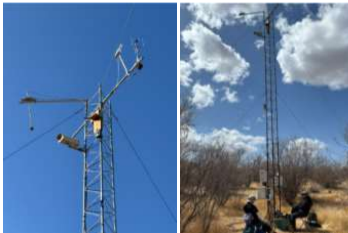
Torre de covarianza de vórtices que mide flujos de Dióxido de carbono ( \text{CO}_2 ) y agua ( \text{H}_2\text{O} ) en el Rancho El Churi en sitio con vegetación natural (13 años de monitoreo). Primer sitio de la red Phenocam Network en México.